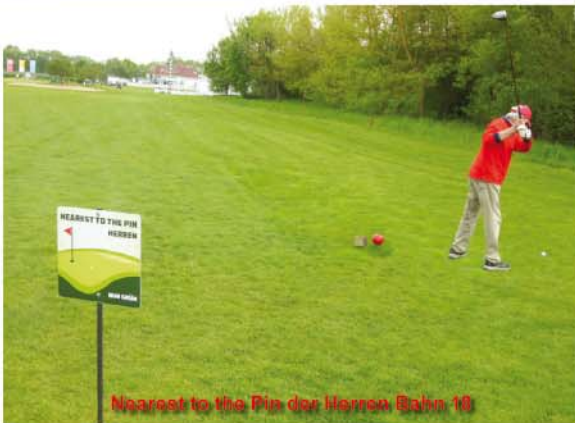
Nearest to the Pin der Herren Bahn 10