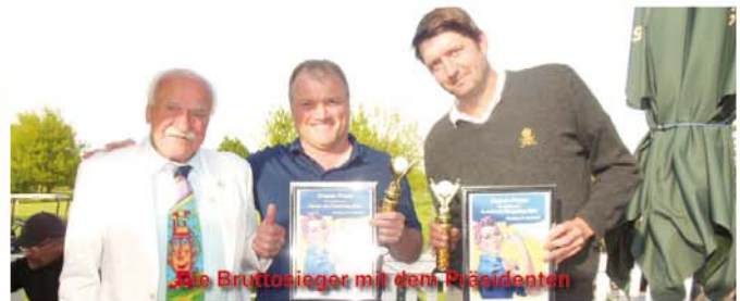
Die Bruttosieger mit dem Präsidenten