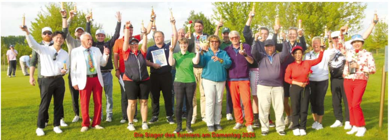
Die Sieger des Turniers am Damentag 2026

Turnierplan: Änderung der Spielform: Nicht Zählspiel, sondern Chapman-Vierer