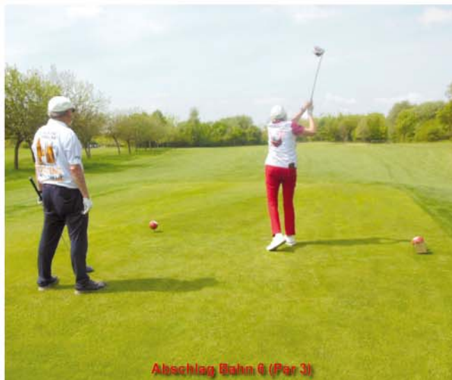
Abschlag Bahn 6 (Par 3)