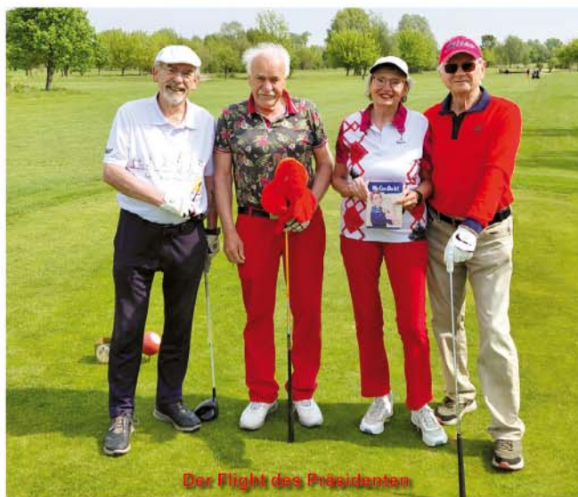
Der Flight des Präsidenten