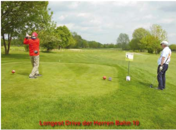
Longest Drive der Herren Bahn 10