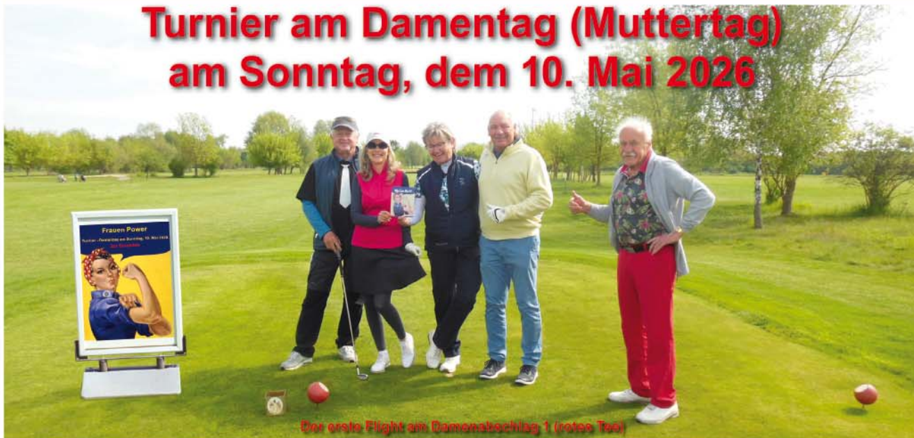
Der erste Flight am Damenabschlag 1 (roter Tee)

Auch dieses Jahr fand am Muttertag unser Turnier am Damentag als 2er Scramble über 18 Loch des Sepp Maier Platzes statt.