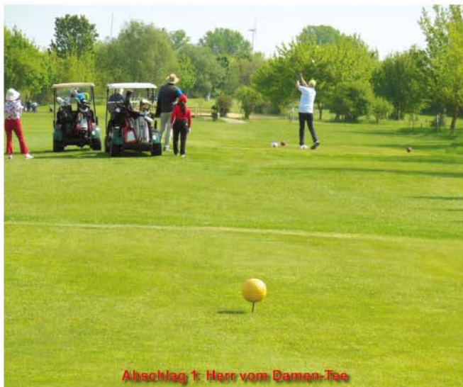
Abschlag 1: Herr vom Damen-Tee