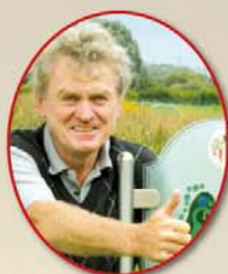
Sepp Maier Gründungsmitglied/Schirmherr