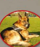
Balou Wachhund (seit Dezember 2004)