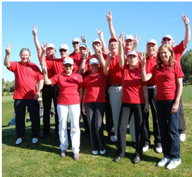
► Die siegreichen Preußen vom Golfclub Pankow

Auch bei der Tombola des Sepp Maier Turniers am 11. Juli 2009 können wieder zwei Glückliche je eine „all inclusive“-Teilnahme an der Turnierreise „Bayern gegen Preußen“ im Februar 2010 gewinnen – gestiftet von Classic Golf Tours.