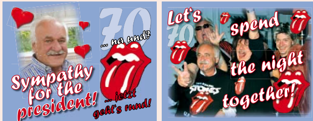
Deko-Fähnchen in der Festhalle

Ganz herzlich möchte ich mich bei allen bedanken, die mir anlässlich meines runden Geburtstages ein so tolles Fest bereitet haben. Vielen, vielen Dank – auch für die Geschenke !!!!!