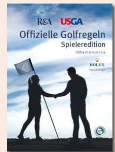
Spieleredition DIN A6 € 8,95