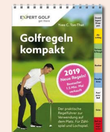
Taschenbuch € 14,95