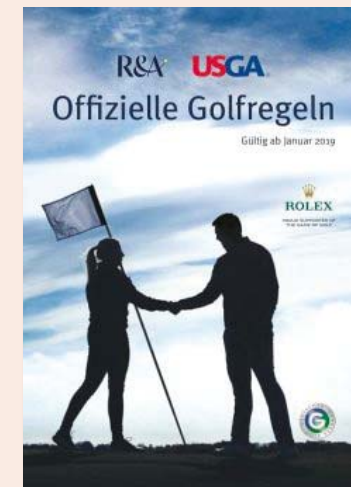
Golfregeln illustriert DIN A5 € 15,95