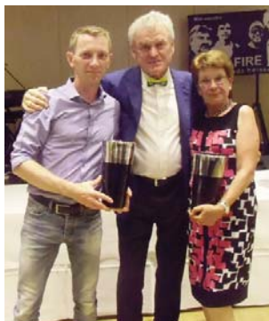
● Die Bruttosieger mit Sepp