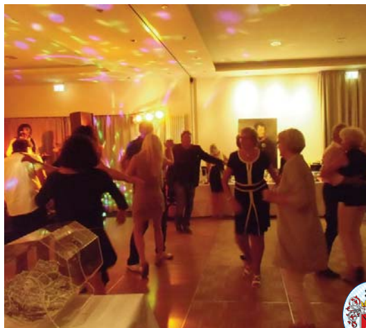
● ... und Tanz