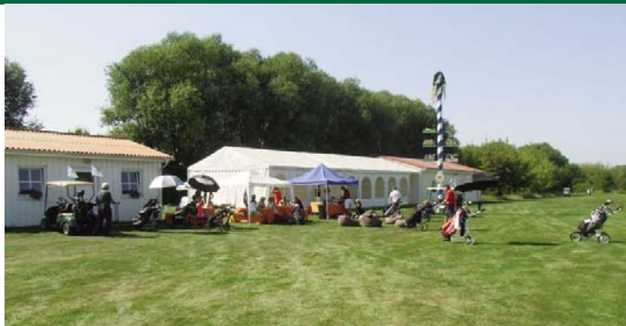
● Pausenstation am Maibaum