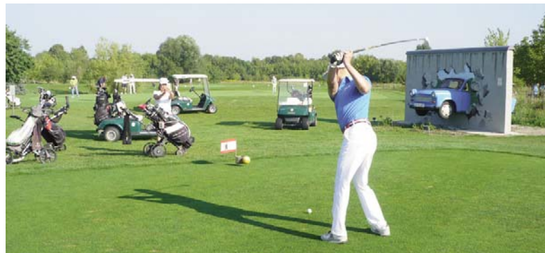
● Am ersten Abschlag