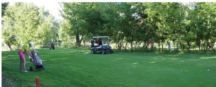
● Auf Bahn 32 (Kurzplatz 2)