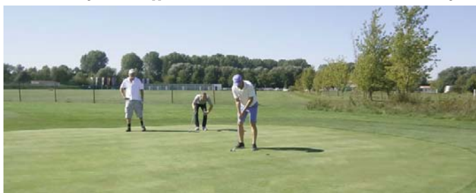
● Auf Grün 4 (Übungsplatz 3)