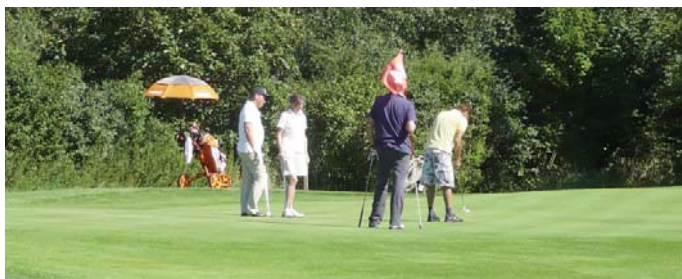
● Putten auf Bahn 26 (SM 14)