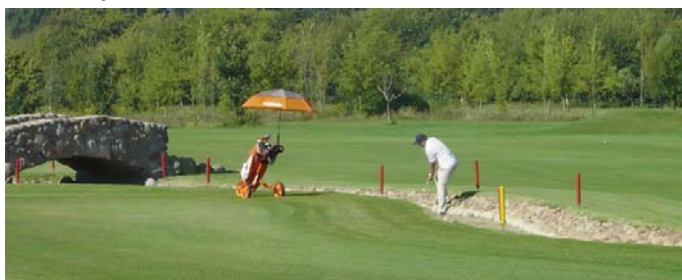
● Kein leichter Schlag auf Bahn 10 (SM 7)