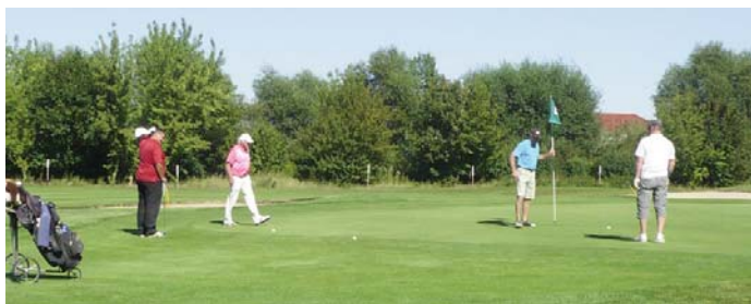
● Grün 18 (Fließ 2)