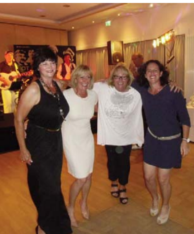
● Gute Stimmung ...