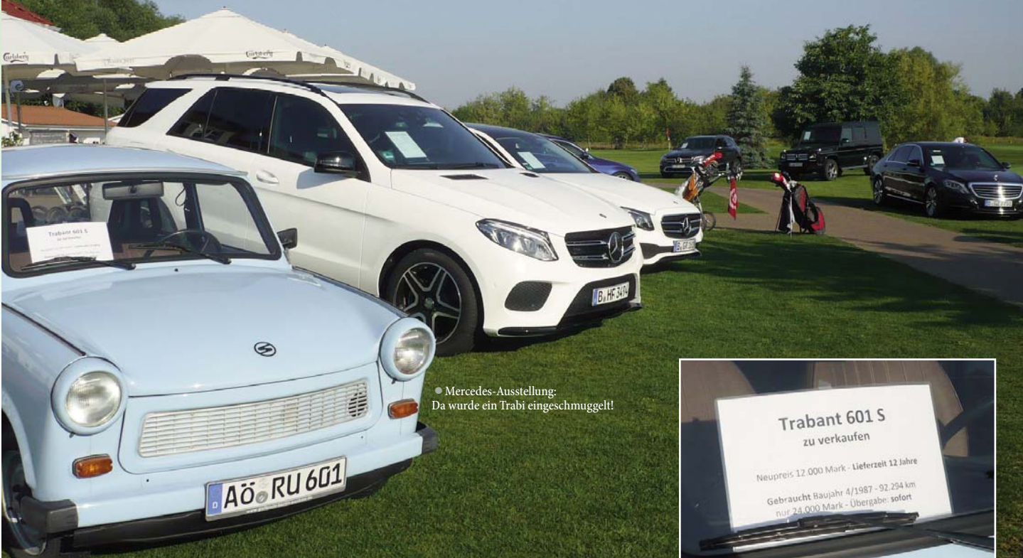
● Mercedes-Ausstellung: Da wurde ein Trabi eingeschmuggelt!