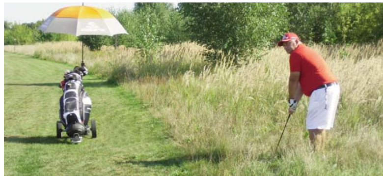
● Schwieriger Schlag aus dem Rough