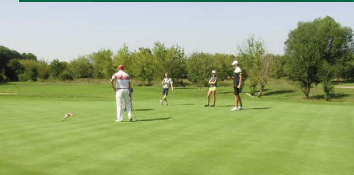
● Die letzten Putts auf Grün 18