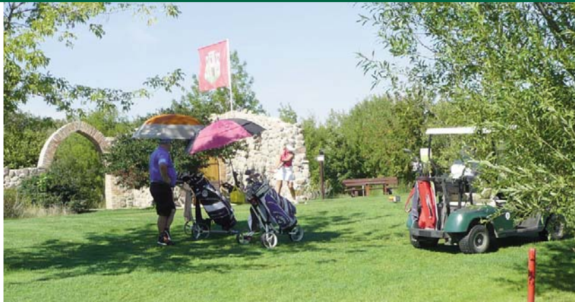
● Abschlag 21 (Fließ 5) an der Burg