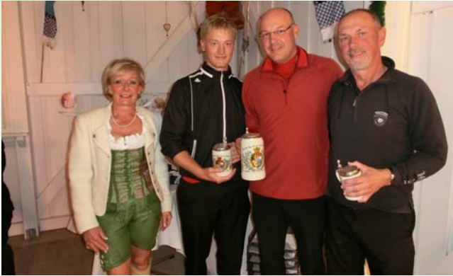
● Netto Klasse B