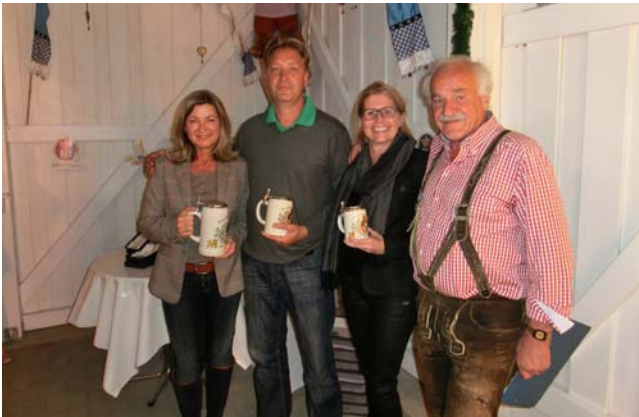
● Netto Klasse E