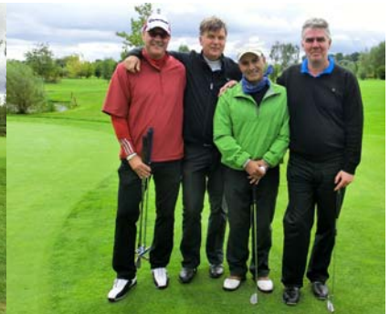
● Am Grün 8