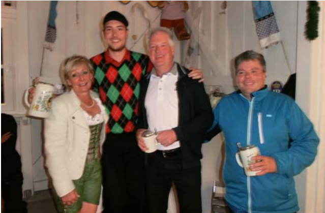
● Netto Klasse C