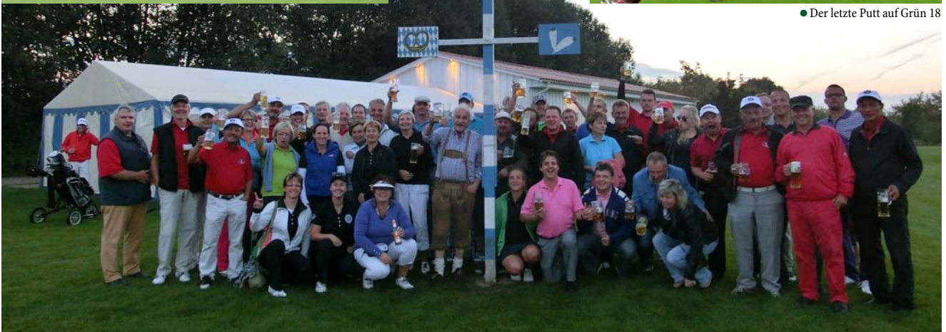
● Am Samstag wurde der „Maibaum“ gesetzt und gefeiert