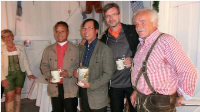
● Netto Klasse D