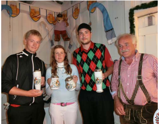
● Die Sieger der Sonderwertung mit dem Präsidenten