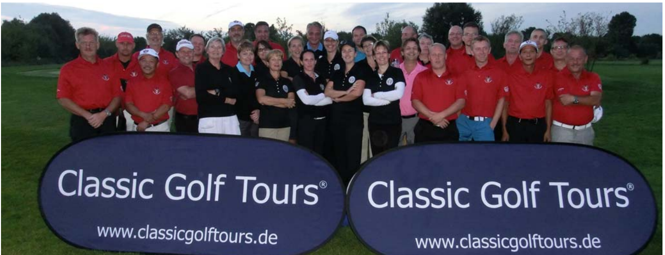
● Die Mannschaften vom Golf Resort Berlin Pankow