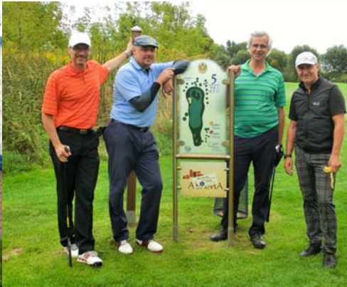
● Vor dem Abschlag 5