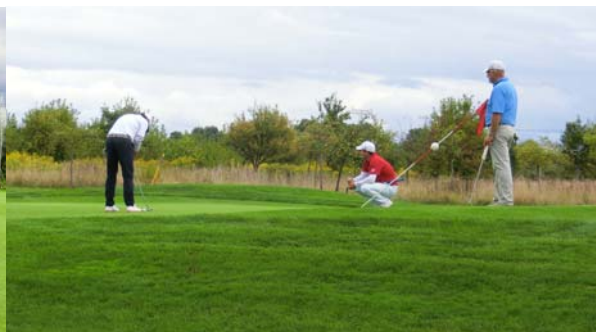
● Auf dem Grün 13