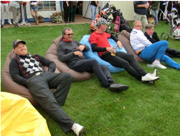
● Die VIP Lounge