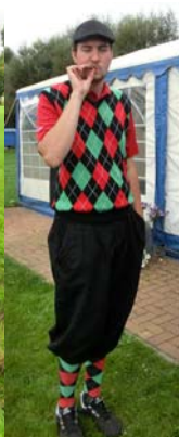
● Old English