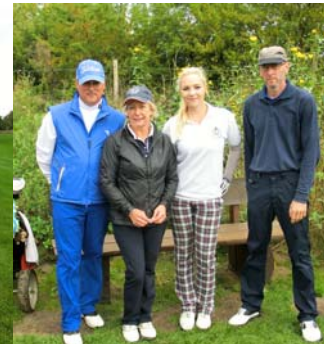
● Am Abschlag 14