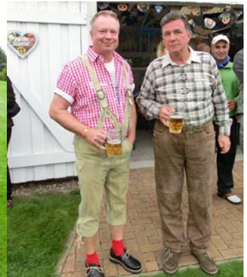
● Zünftig gekleidet zum Oktoberfest