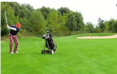
● Am Grün 14