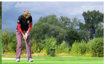
● Auf dem Grün 2