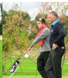
● Auf dem Grün 18