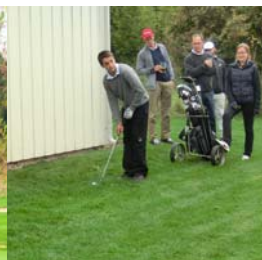
● Ein Ball auf Abwegen