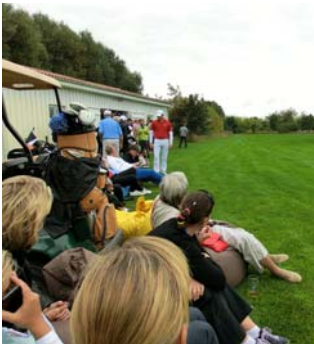
● Alle warten auf den letzte Flight