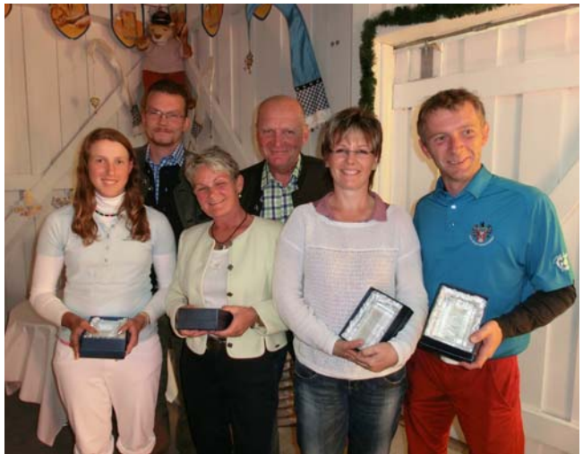
● Die Clubmeister 2013