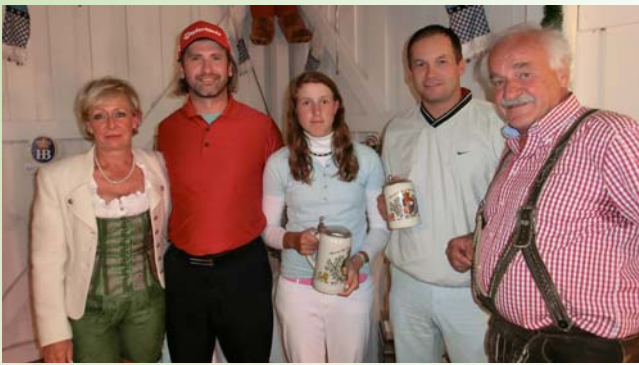
● Netto Klasse A