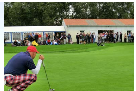
● Der letzte Putt auf Grün 18