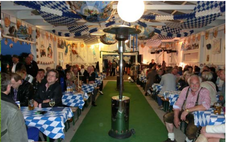
● Unsere Festhalle