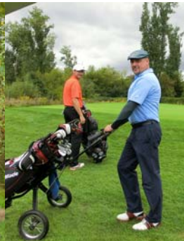
● Am Grün 4