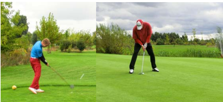
● Abschlag Tee 10