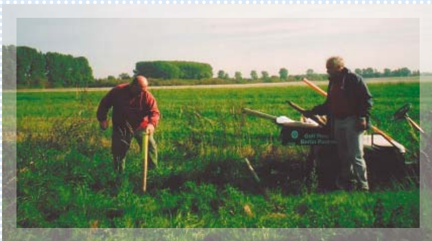
Abstecken der Fläche für den