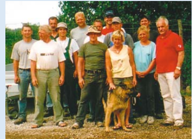
● Das Team im Juni 2005