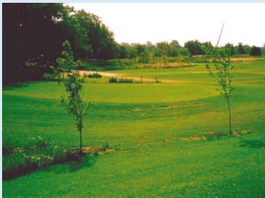
● Langsam wird es ein Golfplatz