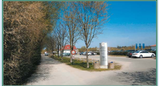
Zufahrt mit Parkplatz und Clubhaus