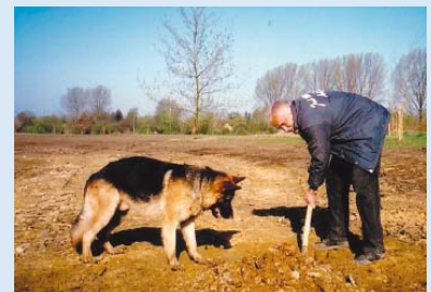
● Der Chef gräbt auf der Suche nach Wasser für den Weiher der Bahn 12