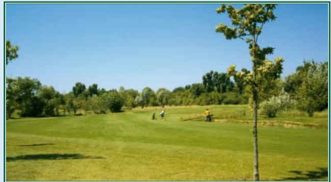
Dogleg der Bahn 12