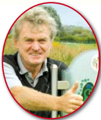
Sepp Maier Gründungsmitglied/Schirmherr