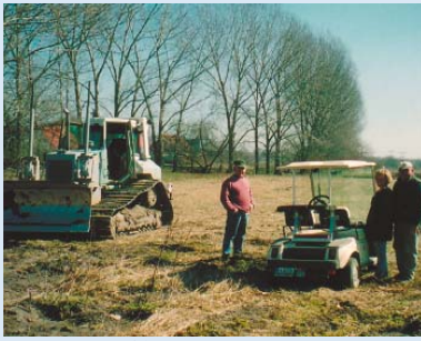
● Unser Raupenfahrer Victor