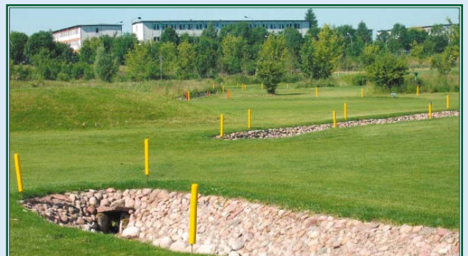
Platz am Fließ