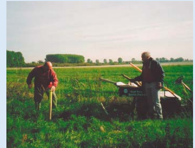
● Erstes Abstecken am Platz: Hier entsteht der 1. Abschlag. Alois Bruckner und Rüdiger Umhau