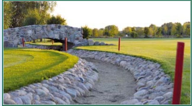
Bahn 7 Sepp Maier Platz