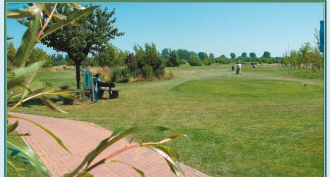
1. Abschlag vom Sepp Maier Platz