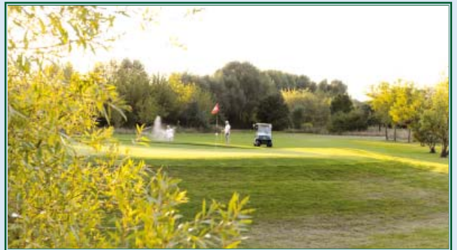
Bunkerschlag zum Grün 18