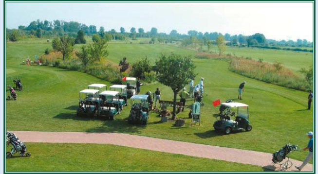
Start am Tee 1 Sepp Maier Platz