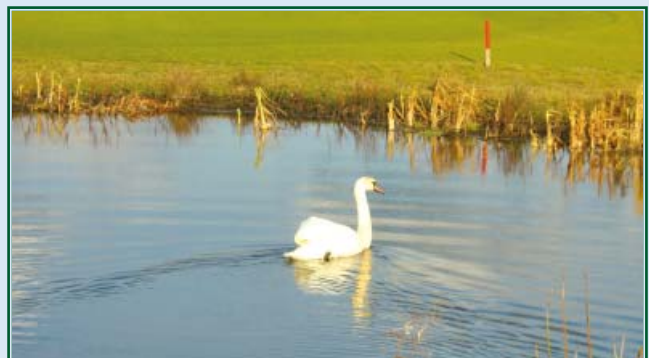
Schwan im Weiher der Bahn 7