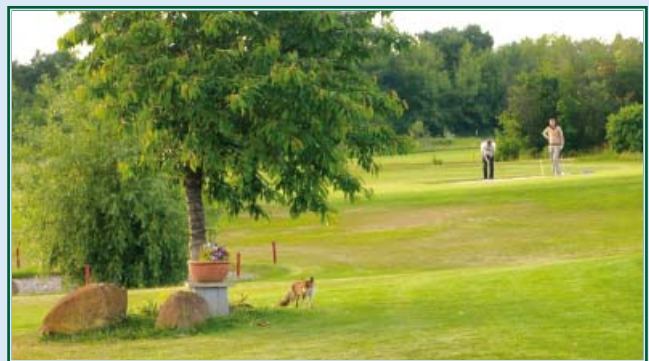
Fuchs am 9. Grün