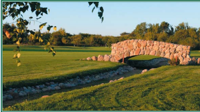
Hentschel Bridge auf Bahn 7