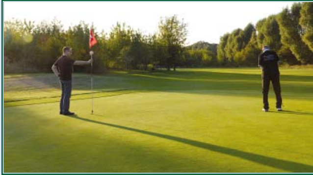
Putten auf Grün 17