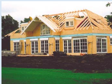
● Das Clubhaus entsteht