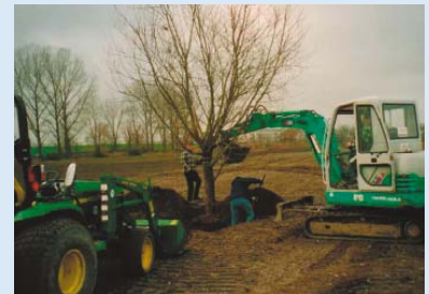
● Und es wird bereits kräftig gepflanzt