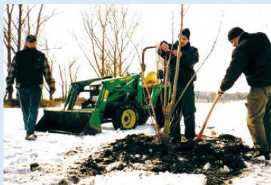
● Es wird weiter gepflanzt