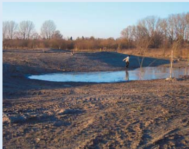
● Die Modellierungen schreiten voran: Wasser hinter Grün 2