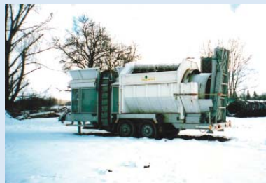
● Der Substrat-Mischer ist eingetroffen