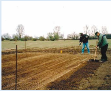
● Feinplanie und Einsatz der Abschläge