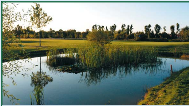
Wasser am Grün 8