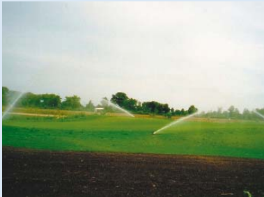
● Endlich ist es soweit: Es grünt so grün.....