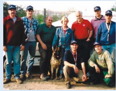
● Das Team im April 2005