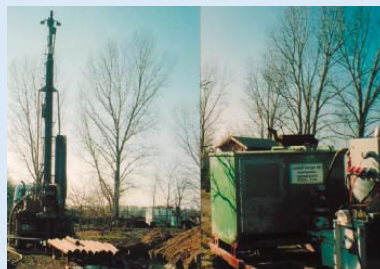
● Ein Grundwasser-Tiefbrunnen entsteht für die Bewässerung