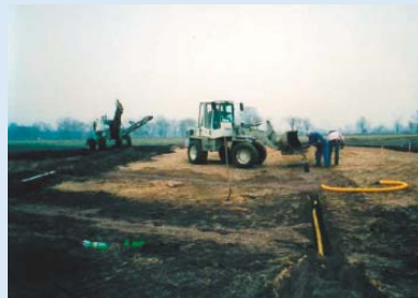
● Die ersten Drainagen werden gelegt