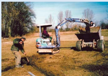
● Drainagen werden angelegt