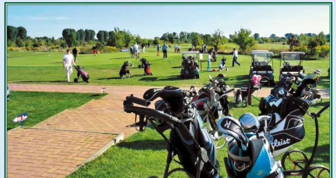
Vor dem Clubhaus mit Putting Grün und Tee 10