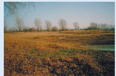
● Endlich ist der Schnee weg: Es kann weitergehen