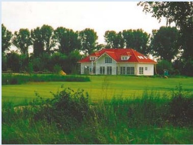
● Das Clubhaus ist (fast) fertig