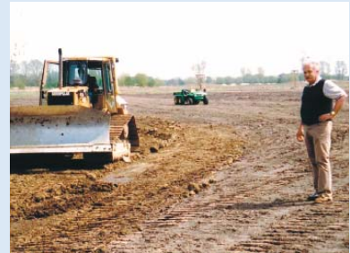
● Es wird weiter modelliert