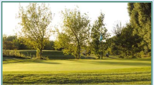
Grün 9 am Fließ