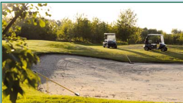
Bunker am Grün 17