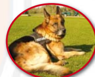
Balou Wachhund (seit Dezember 2004)