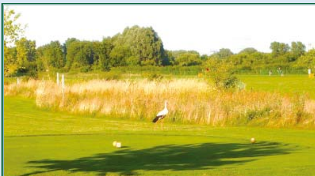
Storch am 1. Tee Sepp Maier Platz