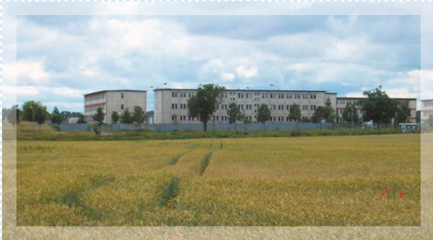
Getreidefeld mit ehemaligen Kasernen