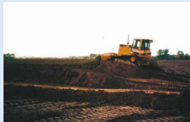
● Die ersten Geländemodellierungen: Hier entsteht das Grün 2