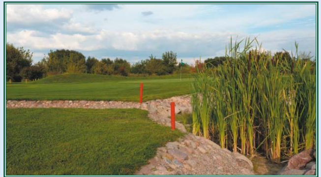
9-Loch Platz am Fließ