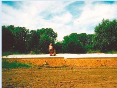
● Die Bodenplatte für das Clubhaus ist fertig