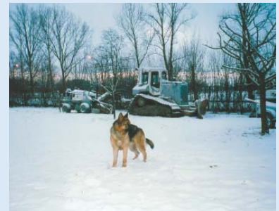
● Wintereinbruch: Balou bewacht die Maschinen