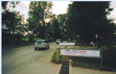
● Die Einfahrt zur Baustelle am Blankenburger Pflasterweg 40