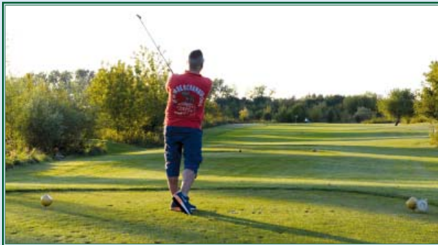
Abschlag 1 am Fließ