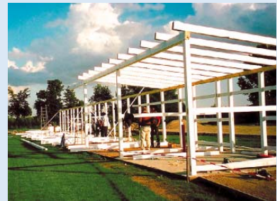
● und der Wetterschutz für die Driving-Range