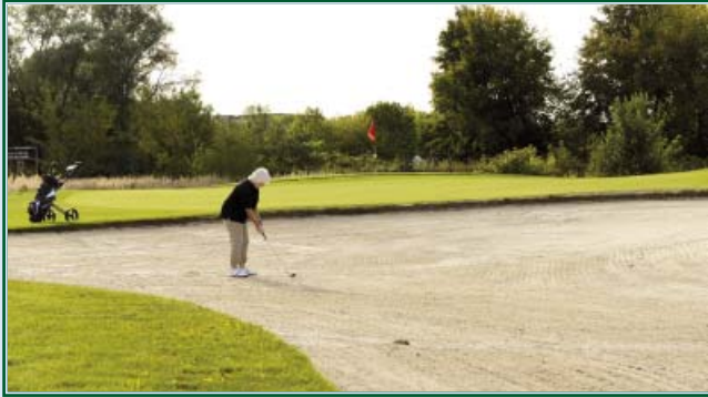
Bunker am Grün 16