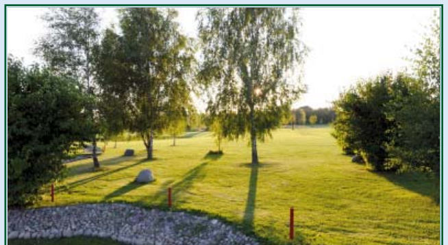
Abendstimmung am Sepp Maier Platz