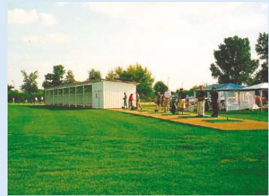
● Die Driving-Range wird bereits genutzt