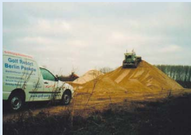
● Der Sand für die Abschläge und Grüns ist eingetroffen