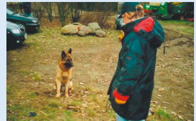
● Unser Wachhund ist dazugekommen: Balou (ist heute noch dabei)