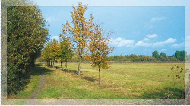
Zugang zum Gelände