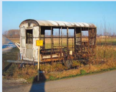
● In der Nacht wurde unser Baustellenwagen von Golfplatzgegnern angezündet (neben vielen anderen nächtlichen Beschädigungen)