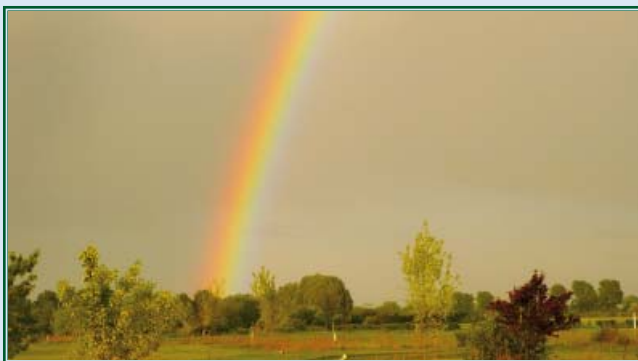
Regenbogen über dem Golfplatz