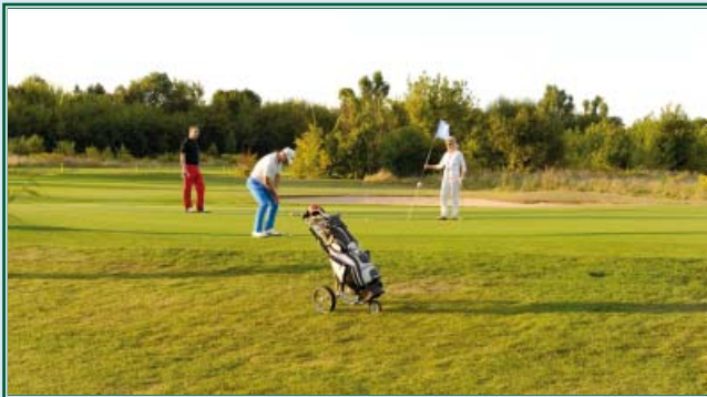
Putten am Grün 9 Sepp Maier Platz