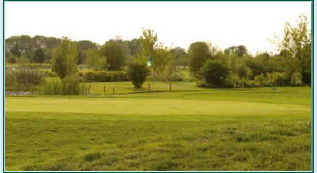
Grün 6 am Fließ