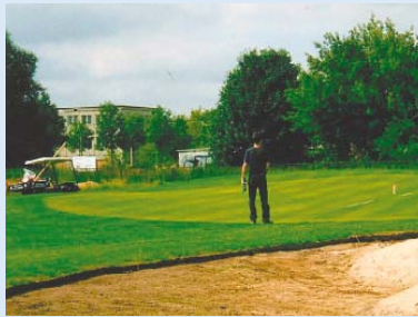
● Vermessung der Grüns durch den DGV