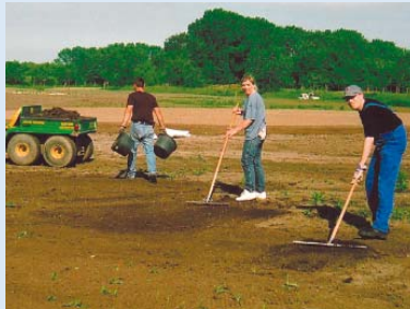
● Handarbeit (Steinerechen) auf der zukünftigen Driving-Range