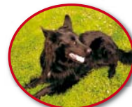
Bruno Wachhund (seit Oktober 2011)